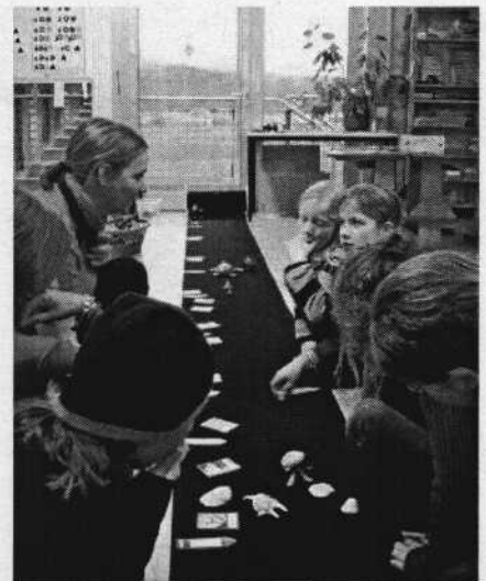
Lernen mit allen Sinnen

Das kommende Jahr wird ein spannendes für Schüler wie Lern-